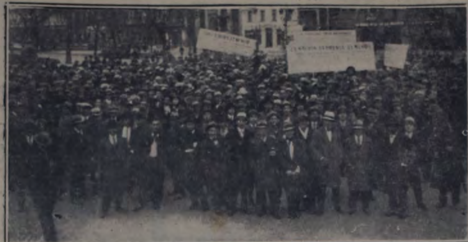
PARTE DE LA CONCURRENCIA A LA MANIFESTACION DE LOS OBREROS Y EMPLEADOS TELEFONICOS, escuchando la palabra de los oradores, después de haber recorrido varias calles de la ciudad, en la plaza del Congreso.

La primera manifestación llevada a cabo, fué la de los obreros y empleados de la Unión Telefónica. Mucho antes de la hora indicada se hallaban presentes en el sitio señalado, numerosos trabajadores, destacándose la presencia de un crecido núcleo de compañeras que, para completar el cuadro, iluminaban con sus sonrisas y alegre disposición, las tonalidades y el colorido de la reunión, animada y numerosa de por sí.